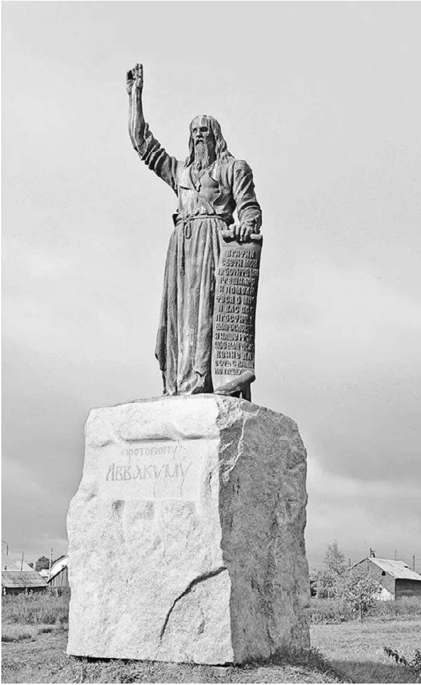
ПАМЯТНИК ПРОТОПОПУ АВВАКУМУ В С. ГРИГОРОВО