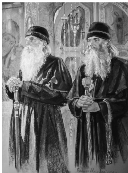
Художник Полина Илюшкина "Предстоятель Русской православной старообрядческой церкви Митрополит Корнилий и епископ Казанский и Вятский Евфимий".

Просветительский отдел Московской митрополии РПСЦ